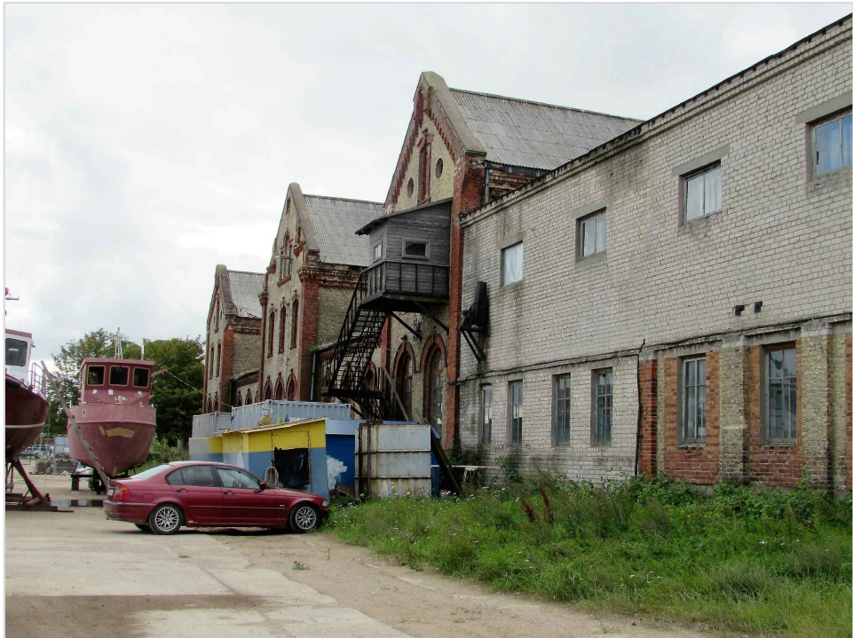
att. 7. Ēkas skatā no krastmalas no kapteiņu dienasta puses. Priekšplānā korpuss 7 ar padomju laikā uzbūvēto otro stāvu un starpbūve D.