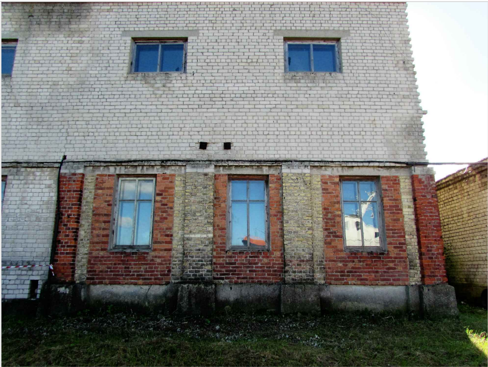
att. 11 . Korpuss 7 ar XX gs. otrā pusē uzbūvēto 2. stāvu. Skats no Ventas puses