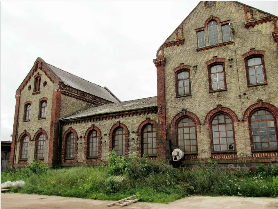
att. 8. Korpusu 1-3 Ventas puses fasādes.