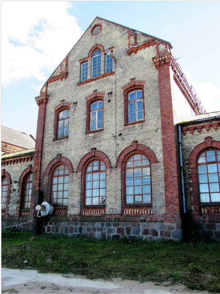
att. 9. Kompleksa centrālais korpuss (3).