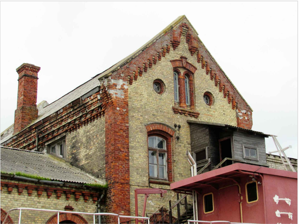
att. 10. Korpuss 5 ar vēlāk piebūvēto ostas novērošanas telpu.